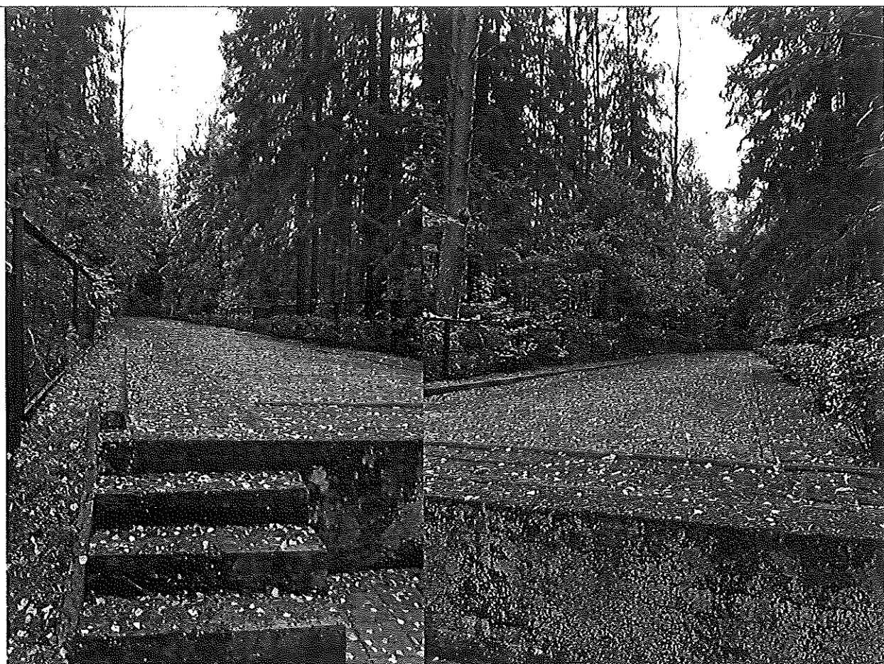
Kultūros vertybių kodas 11382