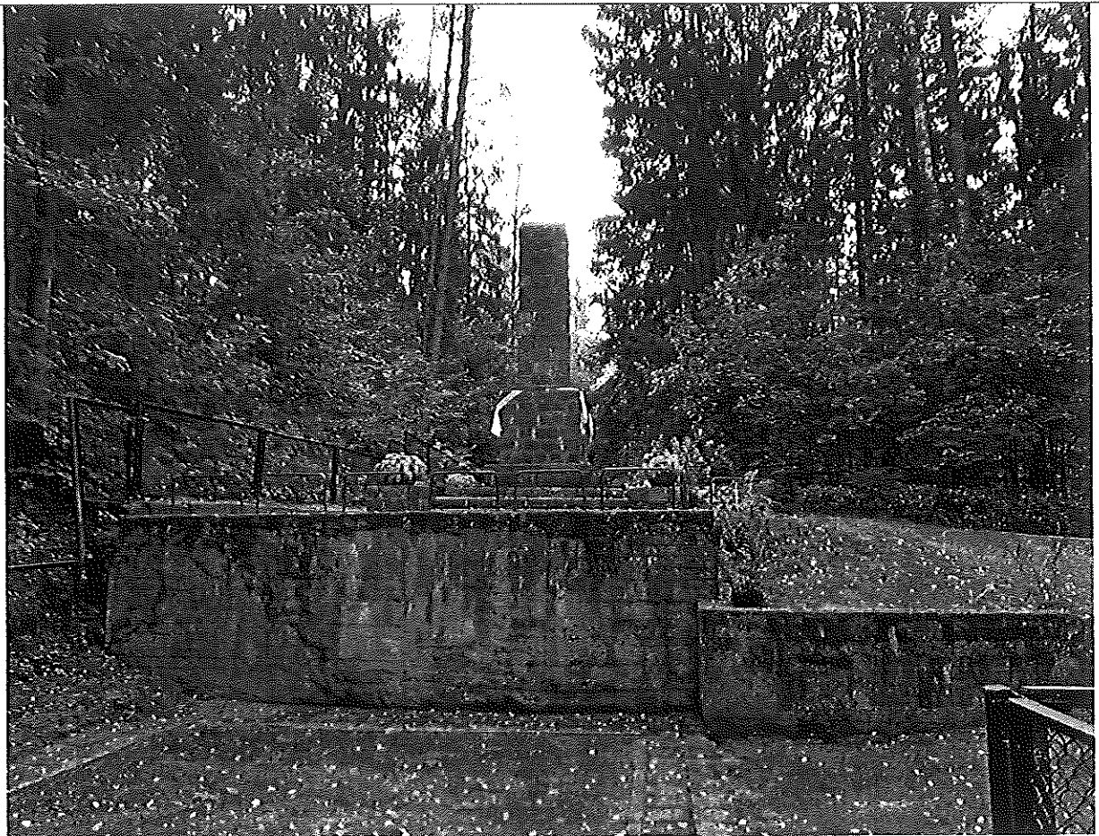
Kultūros vertybių kodas 11382